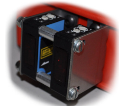
Ansicht von vorne (Laser-Sensoren)