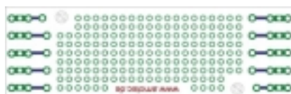
ATQ 350 Abbildung Leiterplatte