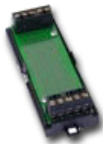
ATQ 350 (Abbildung ohne Gehäusedeckel)