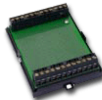
ATQ 700 (Abbildung ohne Gehäusedeckel)