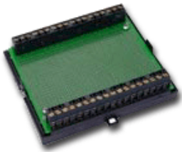
ATQ 1050 (Abbildung ohne Gehäusedeckel)